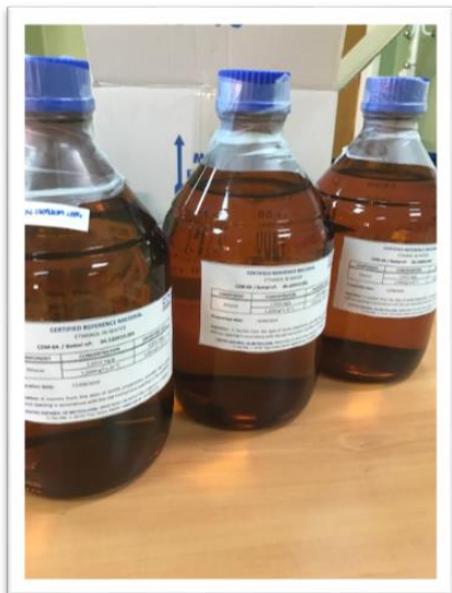
Figura 1. MRC de etanol en agua y certificados

La participación del CEM en los diferentes ejercicios de comparación organizados dentro del proyecto ALCOREF demuestra la capacidad técnica del mismo en la evaluación de la pureza por Karl-Fisher del etanol utilizado en la preparación de los MRC, en la preparación de estos MR por pesada y en la certificación de los mismos por CG-FID, permitiendo al CEM reclamar sus CMC.