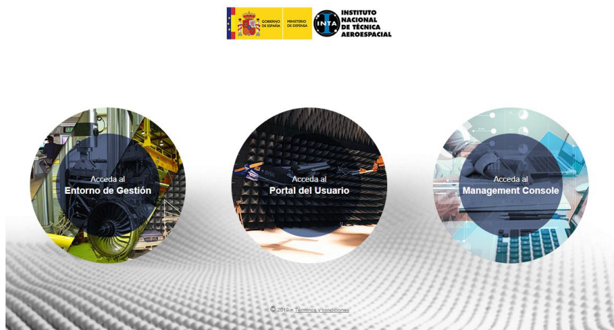
Fig. 3 Pantalla de acceso a la solución software

La plataforma Calibry tiene tres grandes bloques: El entorno de gestión, el portal del usuario y el management console . El primero es el que se usa para la gestión integral del laboratorio, el segundo es para el cliente y el tercero es para la explotación de los datos mediante consultas y análisis personalizado (ver Fig. 3).