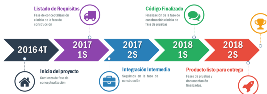
Fig. 1 Resumen de hitos y plan de trabajo

La Fig. 1 resume de forma gráfica el desarrollo de los trabajos, incluidos hitos y entregables destacados de cada una de las fases.