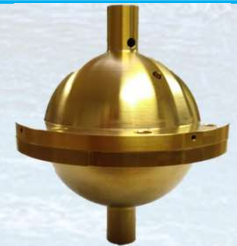
Fig. 2 Resonador cuasi-esférico de microondas de la UVA [2]